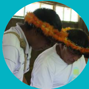
DROITS DES POPULATIONS AUTOCHTONES