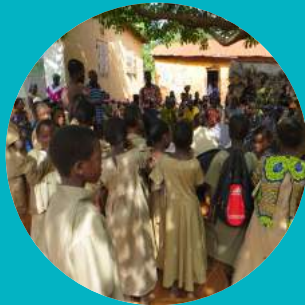
DROITS DES ENFANTS