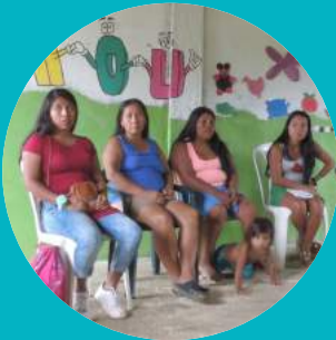
DROITS DES FEMMES