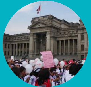
PAIX, JUSTICE ET INSTITUTIONS EFFICACES